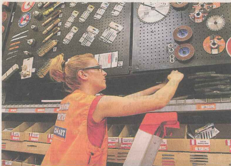
EL PROGRAMA FOMENTA LA INTEGRACIÓN LABORAL DE COLECTIVOS VULNERABLES

Los Premios Incorpora, de los que se celebró su sexta edición, son un reconocimiento para las compañías que fomentan el empleo e integran las preocupaciones sociales en su estrategia empresarial. Por ello, el jurado ha valorado de forma especial el número de